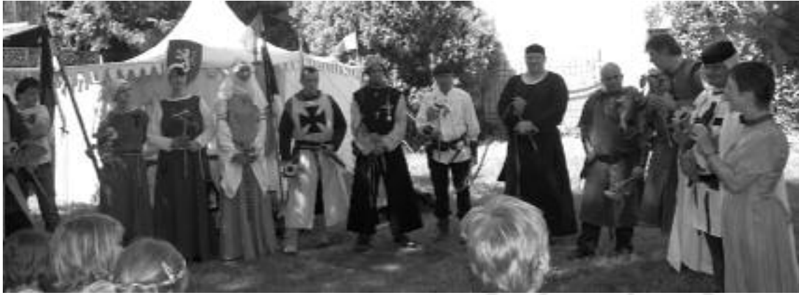
Mittelalter im Kindergarten: Ritter, Barden und Prinzessinnen