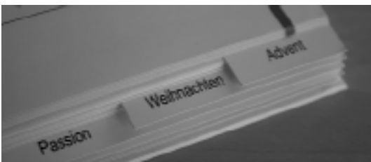
Nach kirchlichen Festen gegliedert: Kochen mit christlichen Traditionen

Die Kochideen sind dem Kirchenjahr zugeordnet. So möchte dieses Koch- und Backbuch Abwechslung in die Küche bringen und den Rhythmus betonen, der in den Kirchenjahreszeiten liegt. Damit dieser Rhythmus des Kirchenjahres auch optisch zum Tragen kommen, wurden die liturgischen Farben mit einbezogen und eine Einführung in die jeweilige Kirchenjahreszeit verfasst.